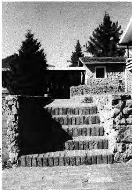
1969-67. Aldea S.O.S. Chaimávida.