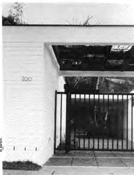
1964. Casa Los Copihues 200. Concepción.