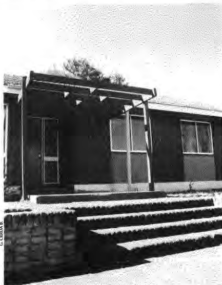
1976-68. Aldea S.O.S. Coyanco, con L. Soto/ C. Jara.

de la catedral penetran y se hacen partícipes del interior de la galería comercial. Lo vemos asimismo en infinidad de viviendas, en que es posible apreciar un sutil juego de espacios virtuales logrados a través de mínimos elementos.