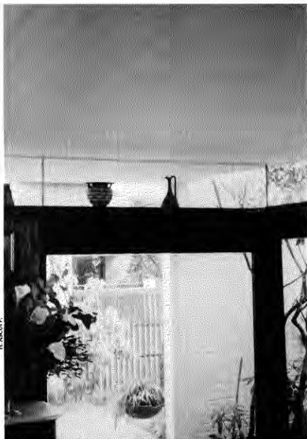
1964. Interior casa Los Copihues 200. Concepción.

En innumerables otras obras aparece esta misma búsqueda de la renovación del concepto de espacio. Lo vemos en las plantas libres del edificio de la Biblioteca Central de la Universidad de Concepción (2), en la fluidez interior-exterior del Casino El Morro de Tomé (3), en el edificio de la Remodelación Catedral (4), en que los patios posteriores